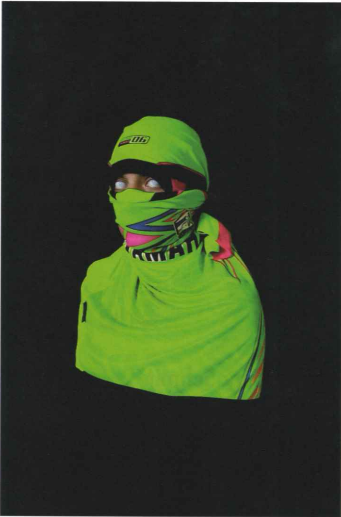
Sara Sadik, Lysopaine , 2019. Impression jet d'encre sur papier / Inkjet print on paper, 150 × 100 cm.