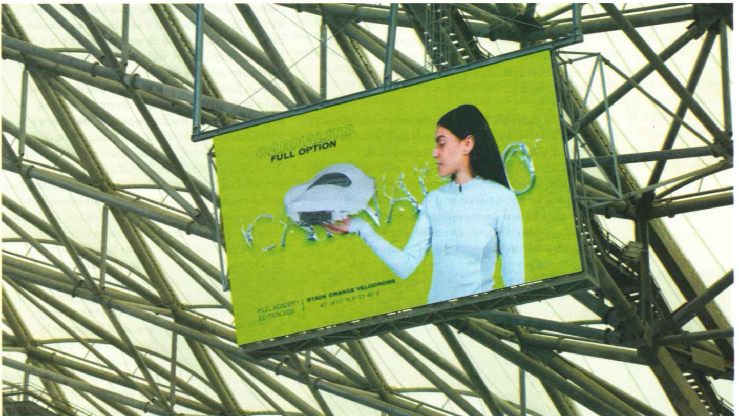
Sara Sadik, Carnalito Full Option , 2020. Vidéo, 20'