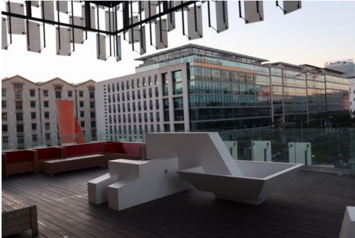
Printemps 2019, Port Vieux, Marsiglia