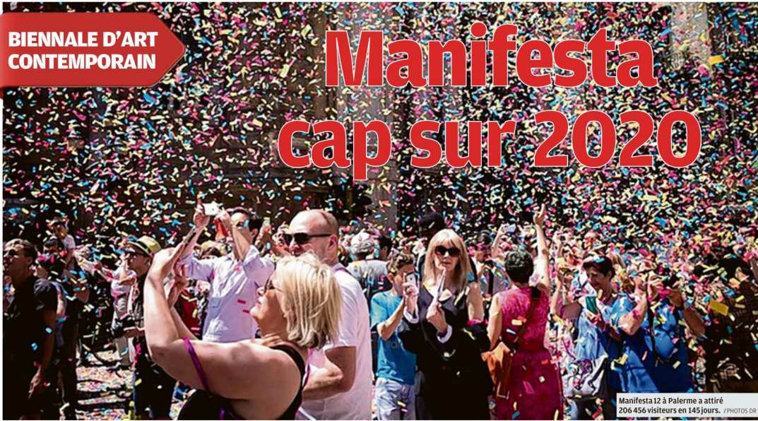
Manifesta 12 à Palermo a attiré 206 456 visiteurs en 145 jours.