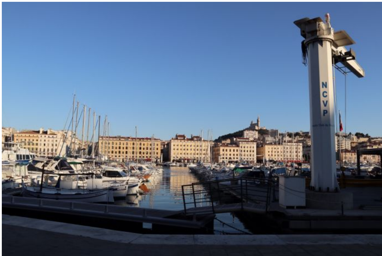
Printemps 2019, Port Vieux, Marsiglia, photo Claudia Giraud

Un anno prima di Manifesta, l'undicesima edizione Printemps de l'art contemporain (PAC) fa le prove generali della prossima biennale che avrà sede nella capitale della Provenza. Le immagini