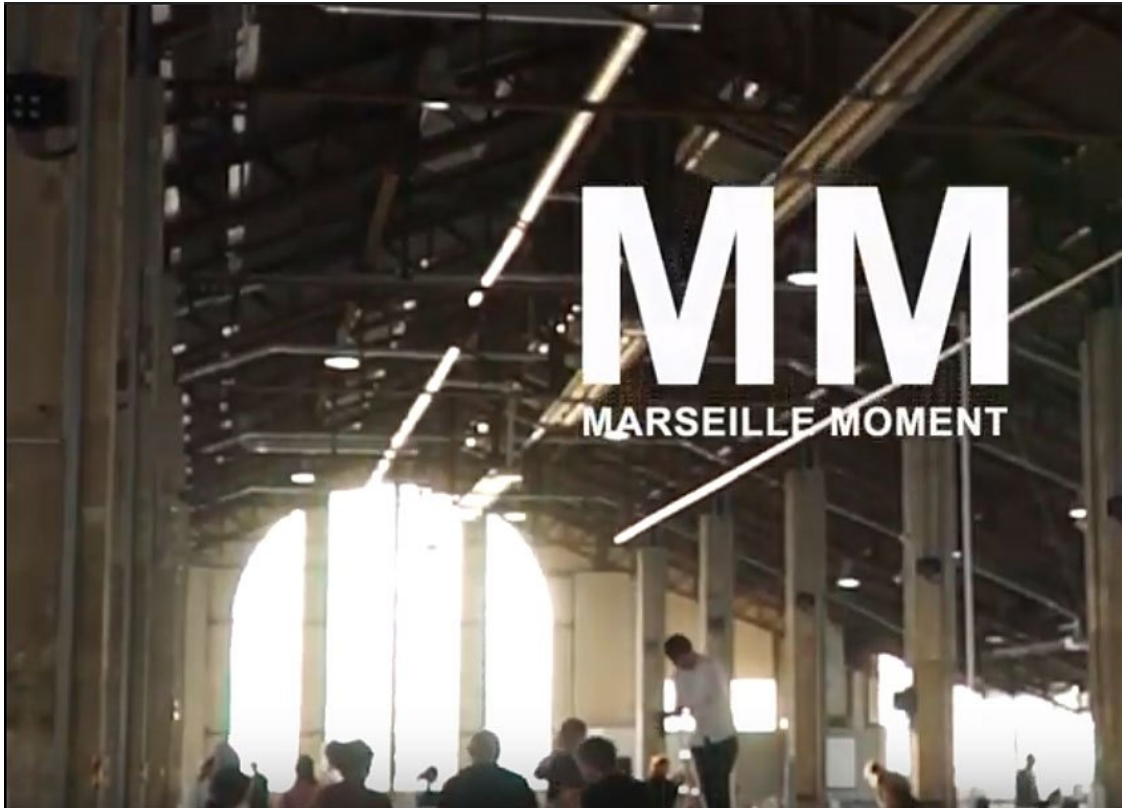
Manifesta 13 Marseille – The Marseille Moment

L'approche comme la méthode choisie par Manifesta 13 est singulière et innovante. « En revenant à Marseille, nous espérons que des événements qui conduiront à la Biennale qui se déroulera du 7 juin au 1er novembre 2020.