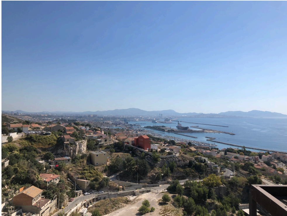
Research trip, 2018, Marseille