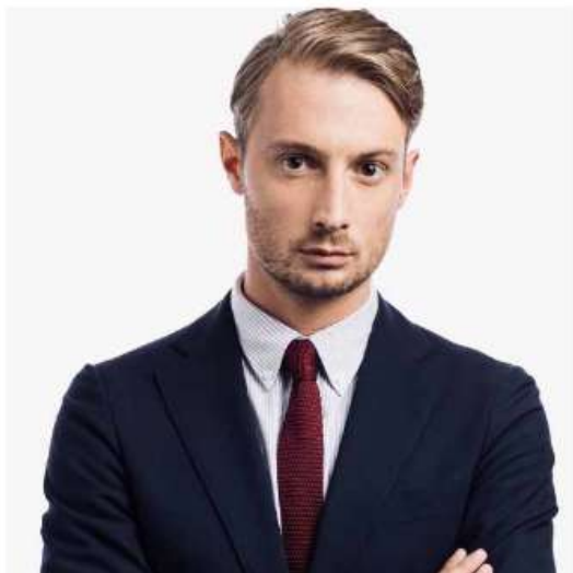
Arnaud Roland.