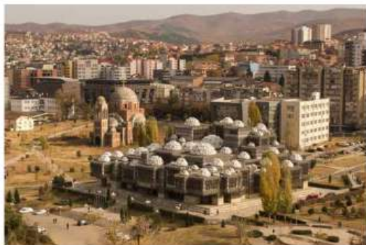
La bibliothèque nationale du Kosovo à Pristina. © Ferdi Limani

Mardi 26 mai, la vente caritative dédiée à Albert Uderzo et organisée par Artcurial au profit de la Fondation des Hôpitaux de Paris - Hôpitaux de France a rapporté 390 000 euros. Lors de cette vacation, les quatre planches originales du dessinateur, offertes par sa femme et sa fille, ont attiré les enchérisseurs. Un nouveau record a été établi pour une planche de Tanguy et Laverdure tirée de l'album Escadrille des cigognes . Adjugée à 150 000 euros, elle pulvérise ainsi son estimation haute de 50 000 euros. Astérix n'est pas en reste : la planche issue de La Galère d'Obélix a été adjugée 95 000 euros, celle de La Rose et le Glaive a quant à elle trouvé preneur pour 80 000 euros. La planche d' Oumpah-Pah , une encre de Chine sur papier de l'album Le Peau-rouge , a atteint 65 000 euros, ce qui constitue un nouveau record pour le dessinateur. Albert Uderzo s'est éteint le 24 mars 2020. A. Co. www.artcurial.com