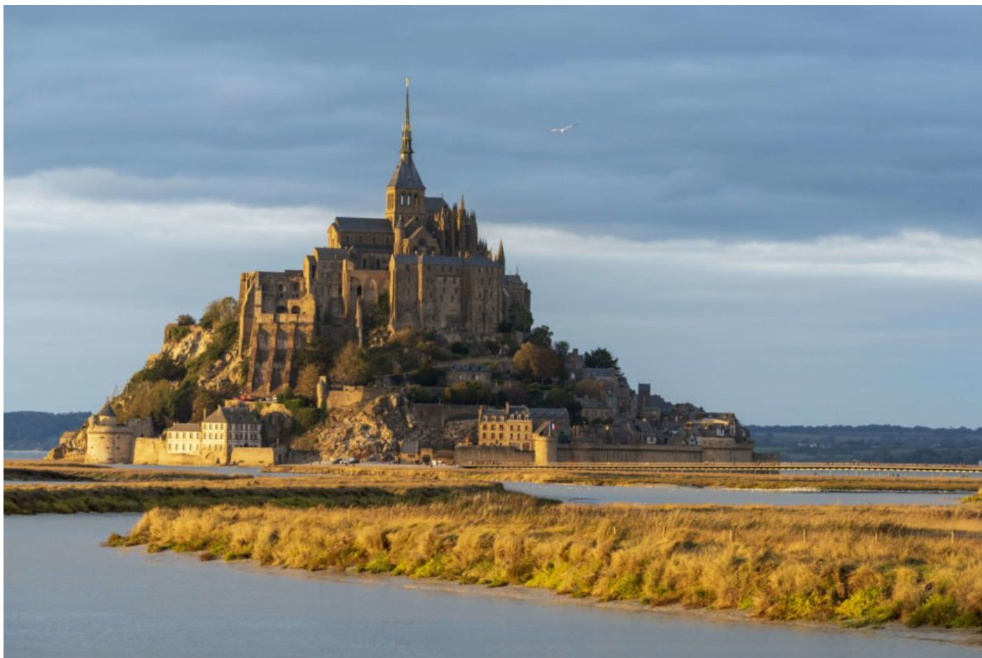
Vue de la baie et de l'Abbaye du Mont-Saint-Michel ⓘ

Deux ministères se sont associés pour protéger le Mont-Saint-Michel : la Culture, bien sûr, et la Transition écologique et solidaire ont travaillé de concert pour créer l'EPIC (établissement public national à caractère industriel et commercial) du Mont-Saint-Michel à partir du 1 er janvier 2020. L'État s'engage dès lors à tripler sa contribution financière. Sept millions d'euros seront investis sur trois ans pour entretenir et restaurer les monuments du Mont-Saint-Michel ; l'EPIC sera également en charge du « fonctionnement des équipements hydrauliques nécessaires au rétablissement du caractère maritime, de l'accueil du public dans l'abbaye, ou encore de celle des navettes et des parkings ». L'idée ? Faire face au tourisme de masse pour préserver un site fragile à bien des égards.