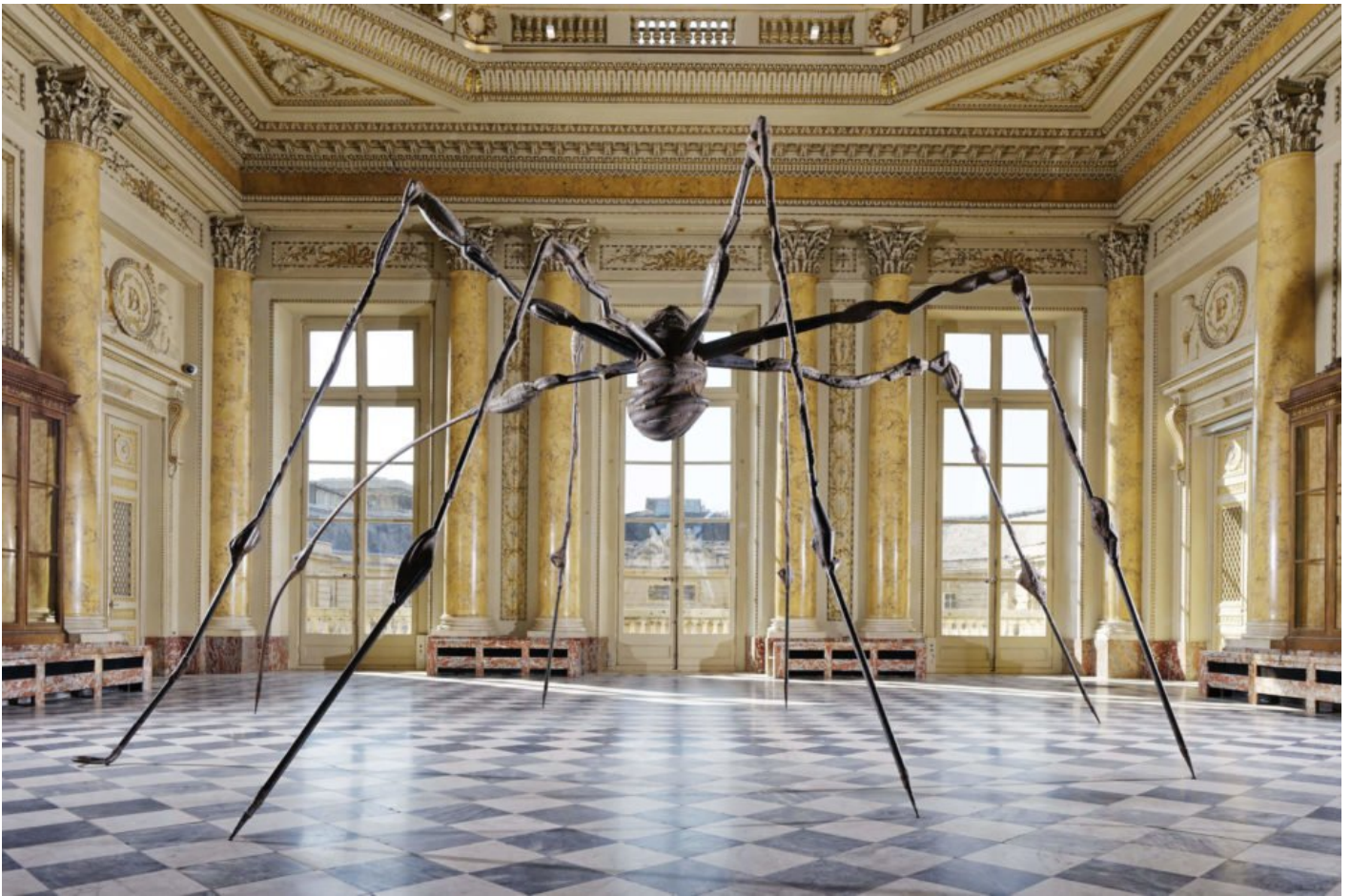
Louise Bourgeois, Araignée (Vue d'exposition « Women House » à la Monnaie de Paris, salon Guillaume Dupré), 1995 ⓘ

À lire aussi : Kiki Smith, chamane de l'art