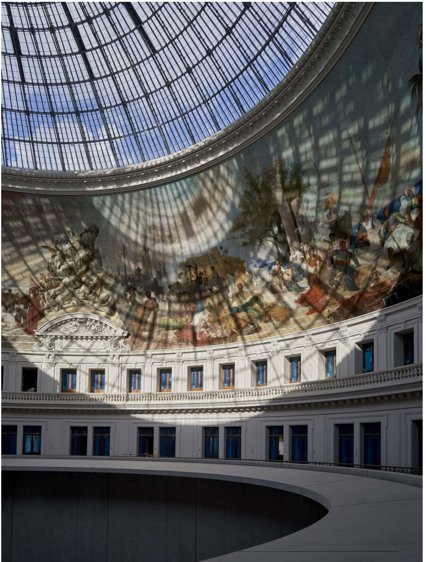
Vue intérieure de la Bourse de Commerce rénovée ⓘ