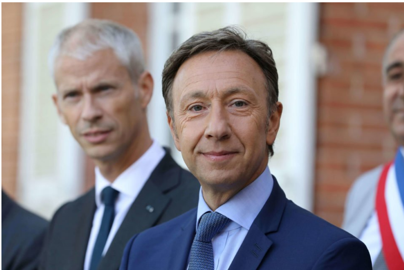
À gauche le ministre de la culture française Franck Riester, à droite Stéphane Bern ⓘ