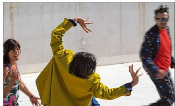
Le spectacle présenté aujourd'hui et demain est né de deux ans de travail au sein de structures de santé mentale ou de grande précarité.

■ Le titre "Moun fou" est-il une référence à la pleine lune ? Ou est-ce un éloge de la folie ? Je suis parti de questions personnelles : pourquoi je donne