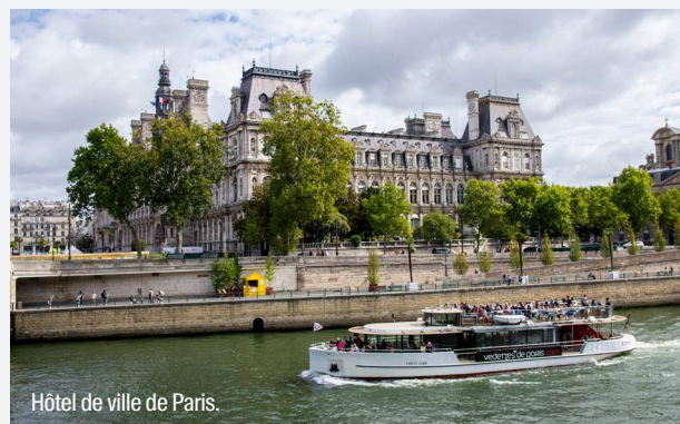
Hôtel de ville de Paris.