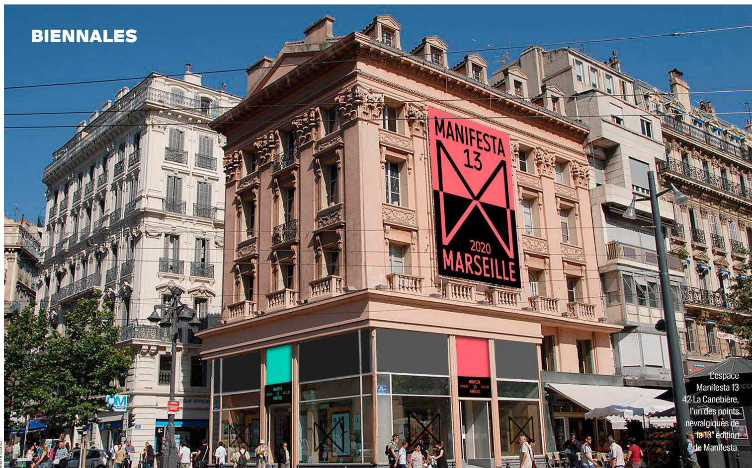
L'espace Manifesta 13, 42, La Canebière, l'un des points névralgiques de la 13 e édition de Manifesta.